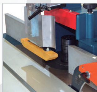
Tupi Spindle moulder Toupie