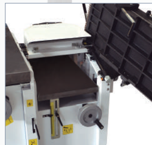
Regreuso Thicknesser Raboteuse