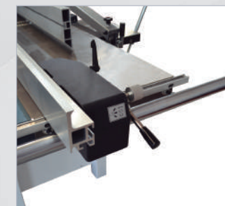
Corte paralelo Cutting width Coupe parallèle