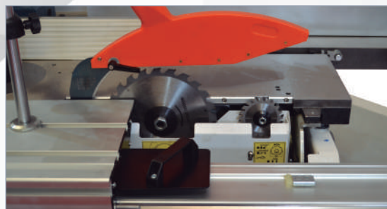
Grupo sierra e incisor Saw blade and scoring group Groupe disque et inciseur