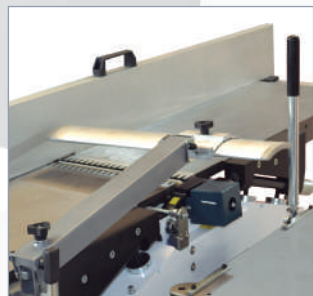
Cepillo Planer Dégauchisseuse