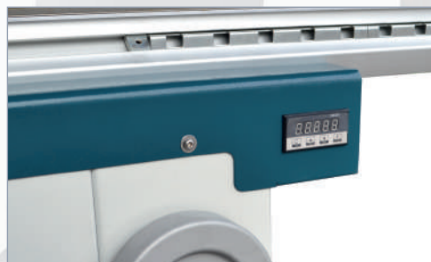
Panel digital Panel digital Panel digital