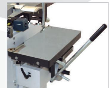
Taladro Morticer Mortaiseuse