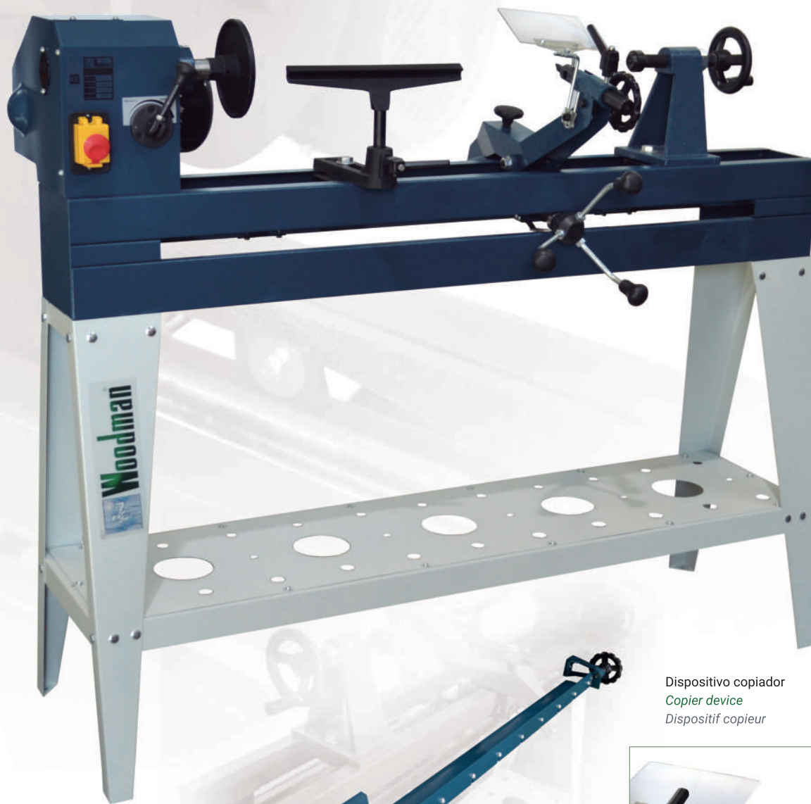
Dispositivo copiador Copier device Dispositif copieur