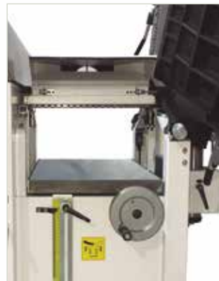
Regrueso Thicknesser Raboteuse