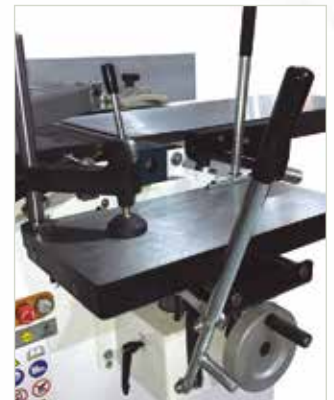
Taladro Morticer Mortaiseuse