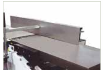
Cepillo Planer Dégauchisseuse

Combinada 3 operaciones cepillo - regrueso - taladro Combination machine planer - thicknesser - morticer Combinée 3 opérations dégauchisseuse - raboteuse mortaiseuse