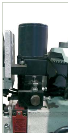
Grupo oscilación lija Oscilating sanding group Groupe d'oscillation bande