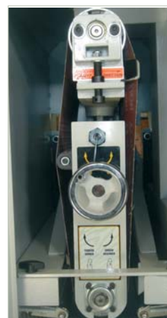
Ajustes banda lija Sanding belt adjust Réglage de bande