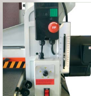
Controles puesta en marcha Start controls Contrôles de mise en marche