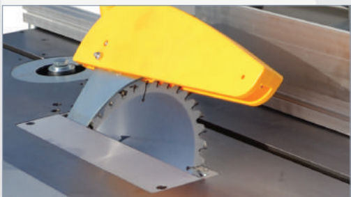
Sierra circular Circular saw Scie circulaire