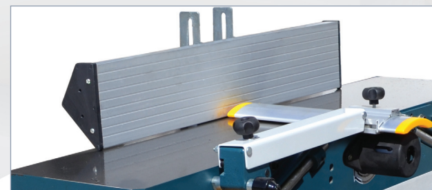
Cepillo Planer Dégauchisseuse