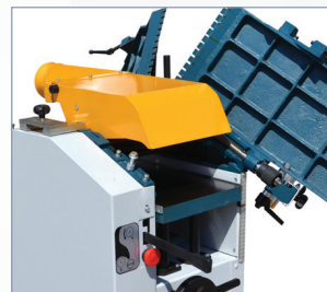
Regrueso Thicknesser Raboteuse