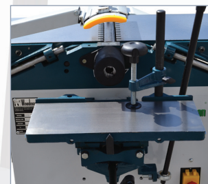
Taladro Morticer Mortaiseuse