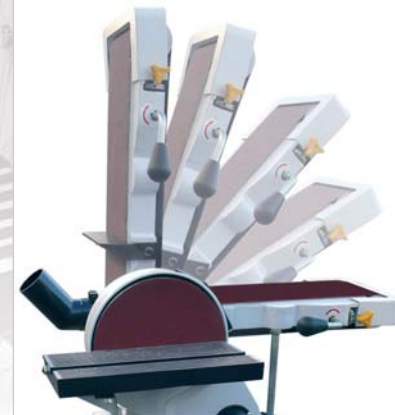
Inclinación de la banda Belt tilting Inclinaison de la bande