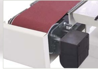
Mecanismo oscilación Oscilation device Dispositif oscilation