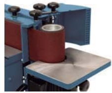
Rodillo para curvas Curved roller Rouleau pour pièce courbée

Lijadora de banda oscilante horiz./vert. Oscilating belt sander horiz./vert. Ponçeuse de bande oscilante horiz./vert.