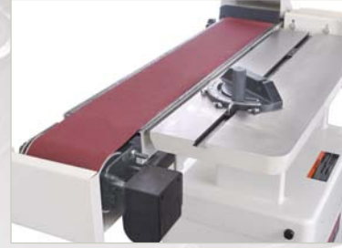
Posición horizontal Horizontal position Position horizontale