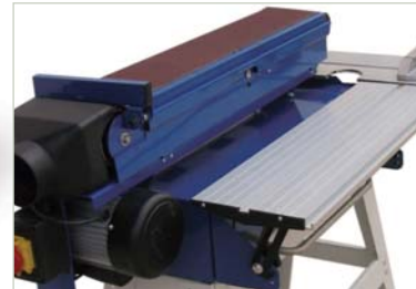
Posición horizontal Horizontal position Position horizontale