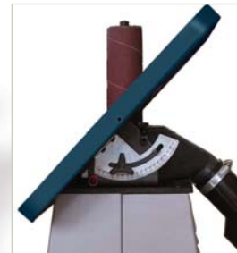
Inclinación de la mesa Table tilting Inclinaison de la table

Lijadora de rodillo oscilante Oscilating roller sander Ponçeuse de rouleaux oscilante