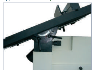
Inclinación de la mesa Table tilting Inclinaison de la table