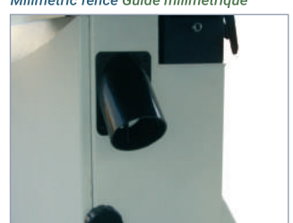
Toma de aspiración Dust inlet Buse d'aspiration