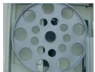
Volante superior Upper wheel Volant supérieur