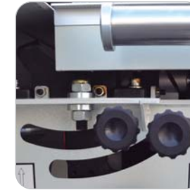
Regulación grupo incisor Scoring adjustment