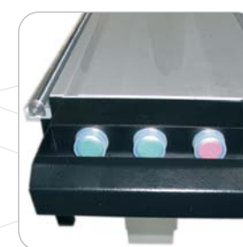
Marcha/paro en carro deslizante ON/OFF in sliding table