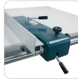
Sistema de corte paralelo Rip fence system