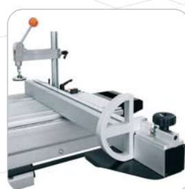
Guía de precisión de corte angular milimetrada Angular millimetre precision guide cut