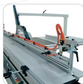
Puente de prensos neumáticos Pneumatic gripper bridge