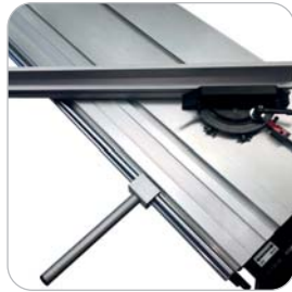
Guía de precisión de corte angular Precision guide for angular cut