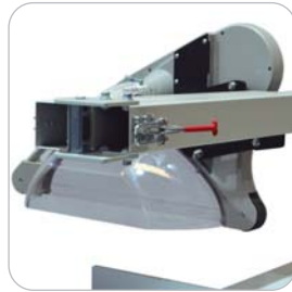
Protector de puente con bisagra de apertura y salida de aspiración Articulated disc protector of bridge and with dust outlet