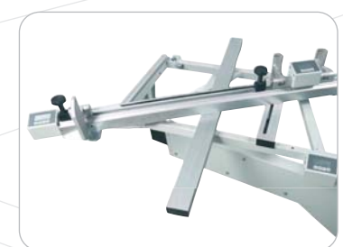
Medidores digitales de corte a escuadra e inclinación Digital readouts for cross and tilt cut