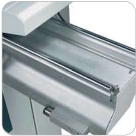
Carro deslizante Sliding table