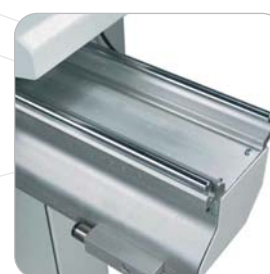
Carro de 3800x395mm. Sliding table of 3800x395mm.